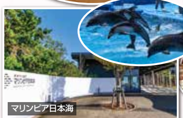
マリニピア日本海