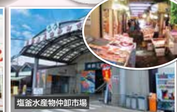
塩釜水産物仲卸市場