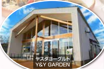
ヤスダヨーグルト Y&Y GARDEN